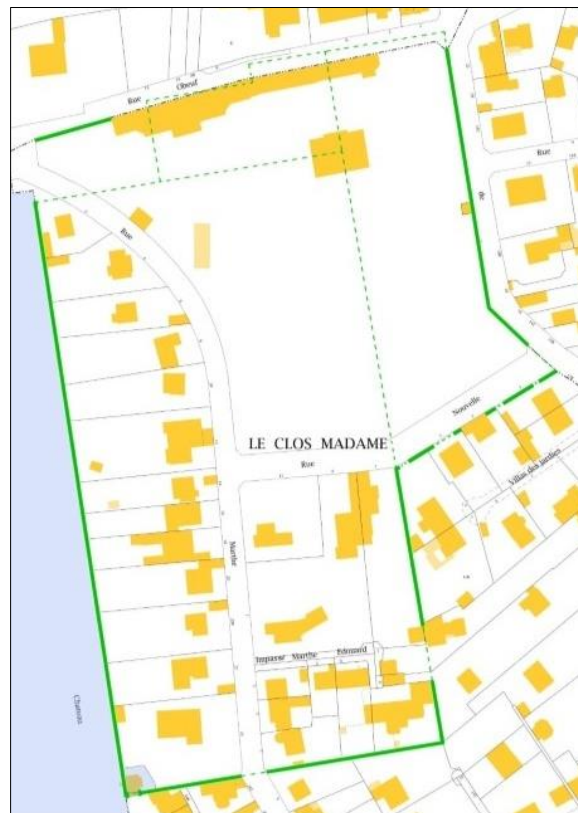
Murs subsistant aujourd'hui de l'ancien Potager du Dauphin

Louvois a créé en 1681 le Potager du domaine de Meudon , dans son tracé initial rectangulaire, puis l'a agrandi en 1691. Le Potager a connu son heure de gloire lorsque le Grand Dauphin s'établit à Meudon de 1695 à 1711 . En 1896, la famille de Porto-Riche , alors propriétaire du Potager, le réduisit à ses limites actuelles en lotissant le reste de la propriété autour des rues Nouvelle et Marthe-Edouard créées à cette occasion.